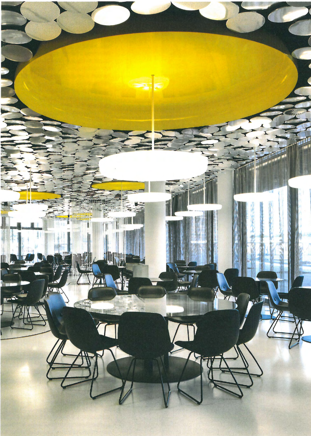
Canteen "DER SPIEGEL", Hamburg, 2011 with Ippolito Fleitz Group