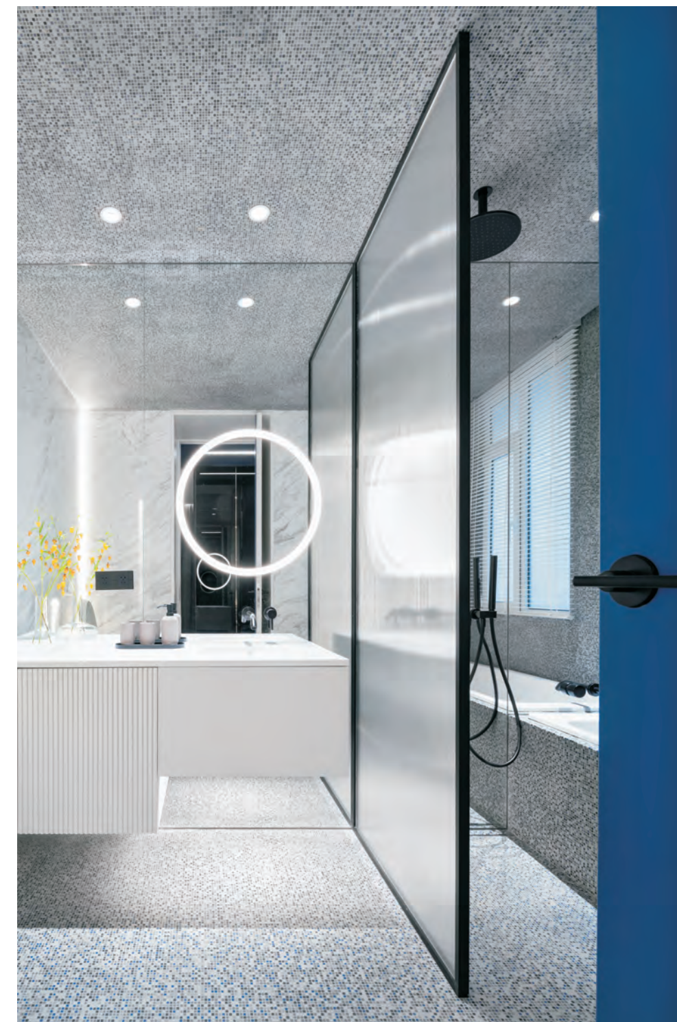
左图 入口门厅 右图 卫浴间

细心观察还会发现空间里运用了很多渐变的元素，比如门厅的渐变镜、客餐厅的渐变地毯、甚至天花和墙面的渐变壁纸，这些色彩的碰撞与空间的其他材质形成了鲜明的对比，更加体现出空间的张力。空间中还巧妙地使用了镜面这个元素，从入口的渐变镜到客厅的双面镜，再到卧室书房的灰镜，不仅从视觉上增添了趣味性，也从空间上提高了整体设计的延续性。